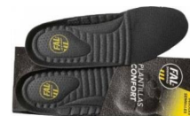
Plantillas extraíbles. Lavable flexible