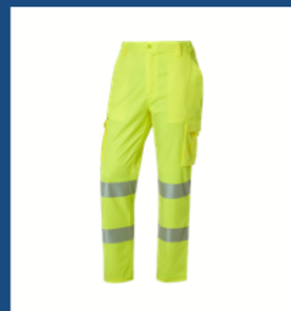
001 Amarillo AV