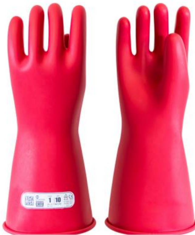
Guantes aislantes de látex - clase 1 - 7 500 V CA